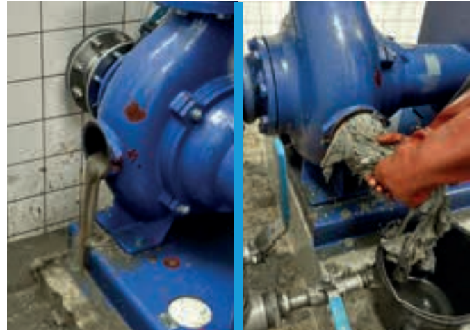
In der Kläranlage der Stadtwerke Weilheim wird eine verstopfte Pumpe geöffnet, Schlamm, Dreck entweicht.