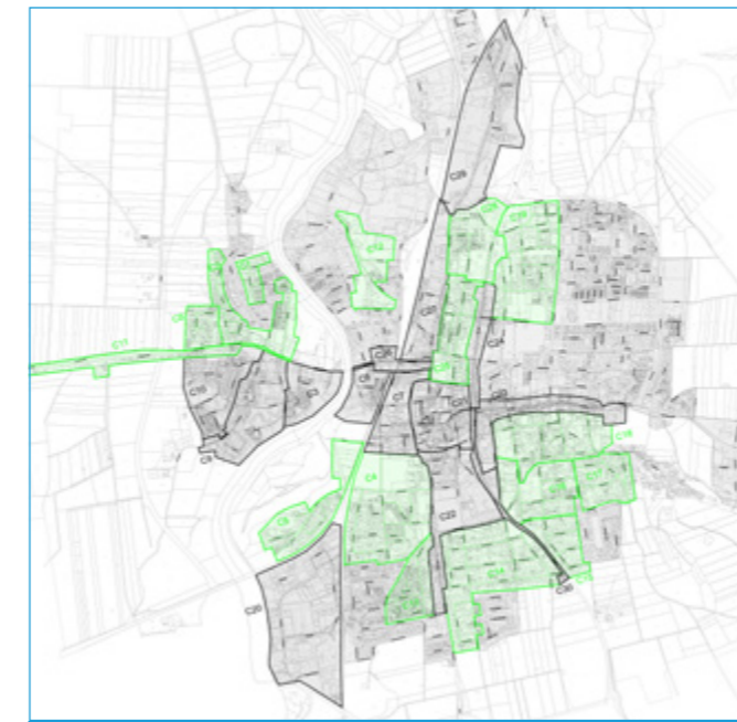
Ausbaugebiet unseres SWE Glasfasernetz in Weilheim, grün markiert

Unser SWE Glasfasernetz wächst, top Angebote über unsere Partner-Provider