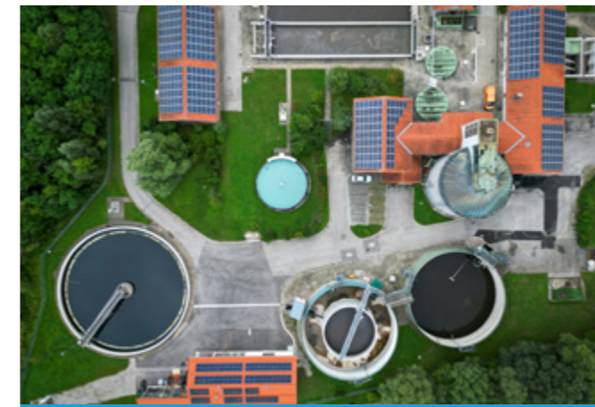
Sie erhöhen die Eigenstromproduktion enorm mit ihren PV-Anlagen auf den Dächern der Sandfilter links, Schlammwässerung unten, Betriebsgebäude rechts

Weniger Stromverbrauch und mehr selbst erzeugter regenerativer PV-Strom