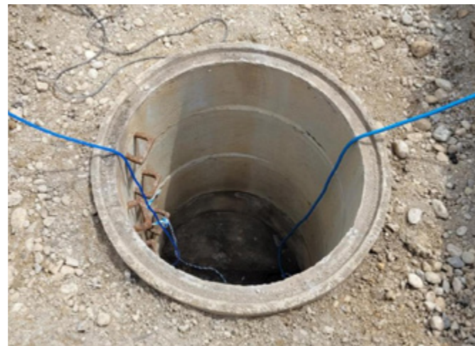
Auch die Schächte werden in der Tankenrainerstraße saniert.

Für den Zeitpunkt der Inliner Sanierung bleibt die Tankenrainerstraße vermutlich einspurig befahrbar. Selbes gilt für die Sanierung der Schächte. Die ausführende Firma organisiert auch eventuell nötige Umleitungen und Verkehrssperrungen, die Anwohner werden im Vorfeld darüber informiert. ■